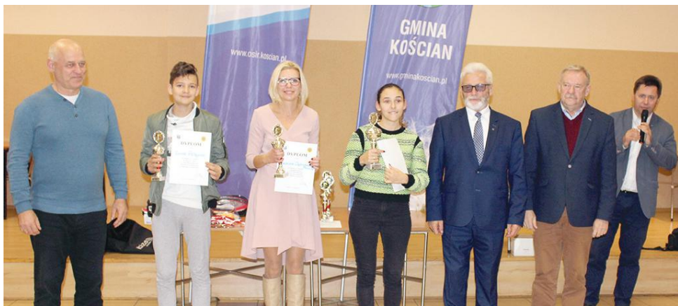
Triumfatorki kategorii kobiet