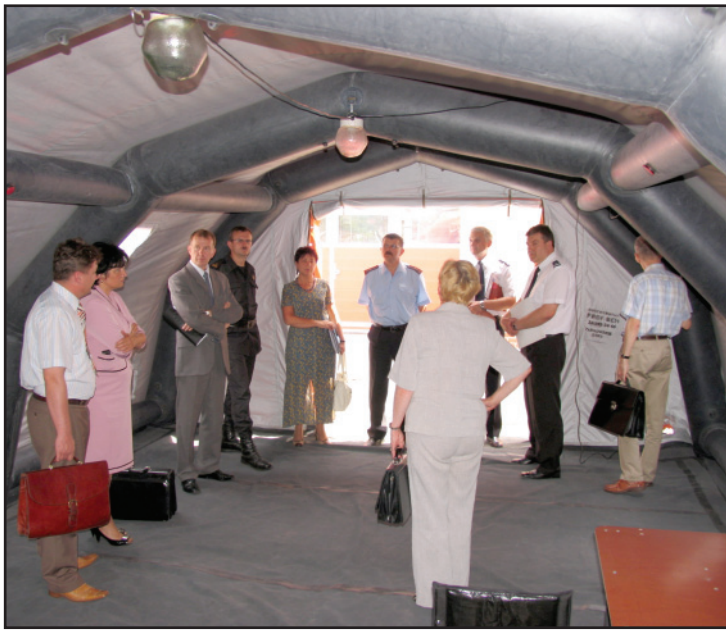
Sprzęt będzie służył wszystkim służbom w powiecie.