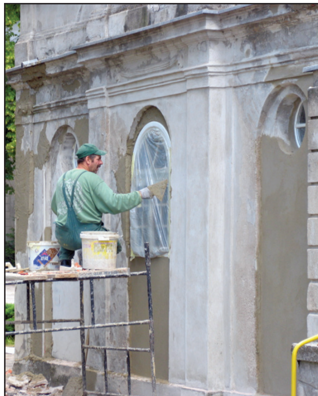
W budynku zamontowano nowe okna, odpowiadające wymogom stawianym przez konserwatora zabytków.