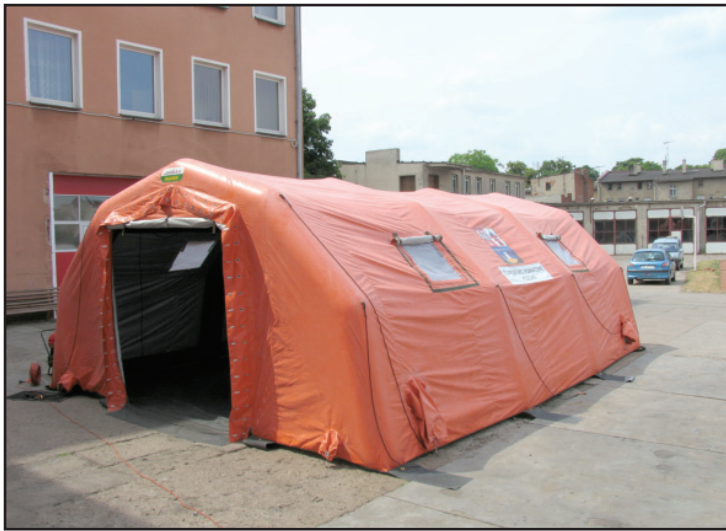
Namiot rozkłada się w ciągu siedmiu minut