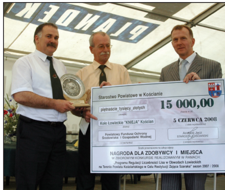
Czek na 15 tys. złotych otrzymało najlepsze Koło Łowieckie.

Podsumowując realizację Programu, Starosta Kościański i obecni na spotkaniu przedstawiciele Kół Łowieckich wyrazili wolę kontynuowania go w kolejnych latach. bj