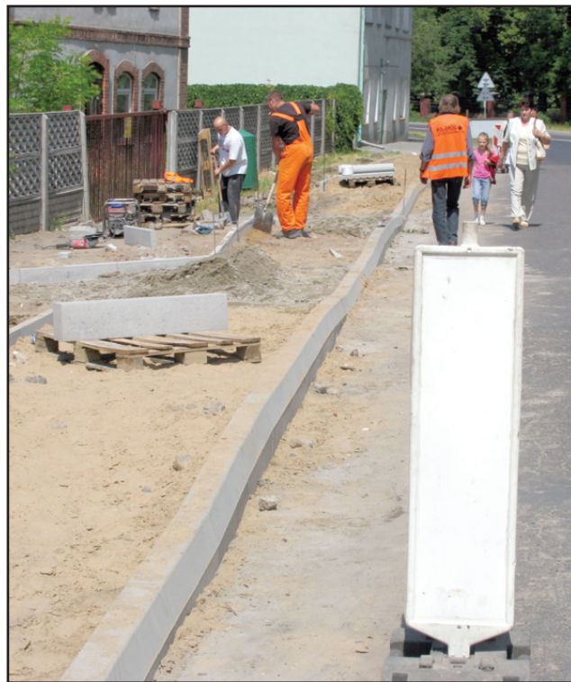
Remont drogi w Czempiniu to dalszy etap prac zrealizowanych w ubiegłym roku.

ku tej ulicy będą kosztowały prawie 297 tys. złotych. W Gryźynie jest remontowany odcinek o długości pół kilometra. Droga będzie odwodniona, poszerzona z lewej strony zostanie wybudowany chodnik i parking przy cmentarzu. Koszt prac to prawie 295 tys. złotych. Zgodnie z umowami zawartymi przez Zarząd Dróg Powiatowych w Kościanie z wykonawcą, firmą „POL-DRÓG” z Kościana prace zakończą się do 30 września 2008 roku. bj