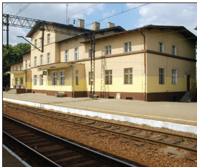
Szpecące elewację budynku napisy i rysunki, zgodnie z informacją zawartą w piśmie zostały już zamalowane.