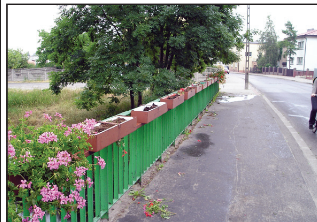
Tak wyglądał most na ul. Marcinkowskiego w poniedziałkowy poranek 16 czerwca.