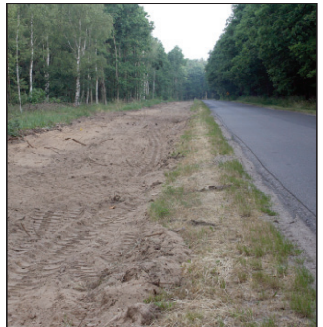
Przygotowanie drogi pod budowę ścieżki rowerowej Racot-Gryżyna

Termin zakończenia prac ustalono na koniec listopada 2008 r. Na zadanie została zaciągnięta pożyczka z Wojewódzkiego Funduszu Ochrony Środowiska i Gospodarki Wodnej w Poznaniu w kwocie 1.100.000 PLN.