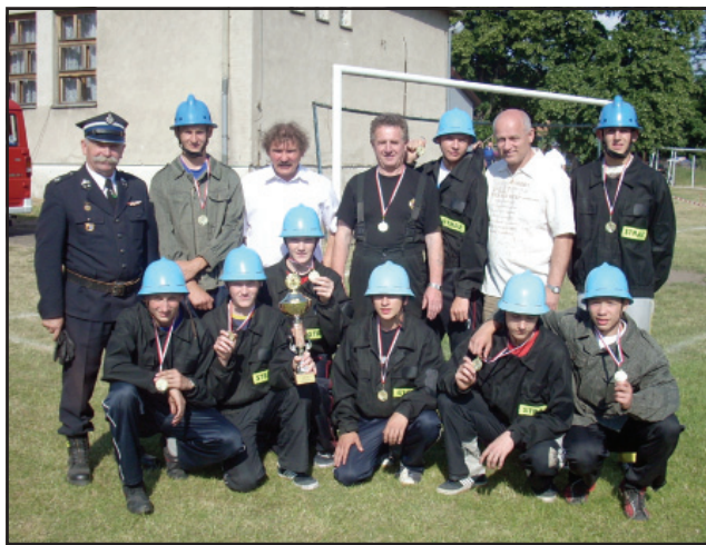
Drużyna młodzieżowa z Turwi.

W niedzielę 15 czerwca br. na stadionie w Racocie odbyły się Gminne Zawody Sportowo – Pożarnicze. W zawodach wzięło udział 37 drużyn pożarniczych, które rywalizowały w czterech kategoriach. Ogółem w gminnych zmaganiach pożarniczych wystartowało ponad 350 strażaków ochotników. Rywalizacja przyniosła następujące rozstrzygnięcia: w kategorii seniorów wygrała drużyna Racot I przed Wławiem i Turwią, wśród kobiet triumfowały reprezentantki Racotu przed Wławiem, w kategoriach młodzieżowych drużyn pożarniczych wśród dziewcząt wygrał Racot przed Starymi Oborzyskami i Spytkówkami, a wśród chłopców zwycięstwo przypadło Turwi, która wyprzedziła Stare Oborzyska i Racot. Tym samym młodzi strażacy z Turwi potwierdzili supremację w powiecie kościańskim osiągniętą tydzień wcześniej podczas zawodów w Czaczu. (md)