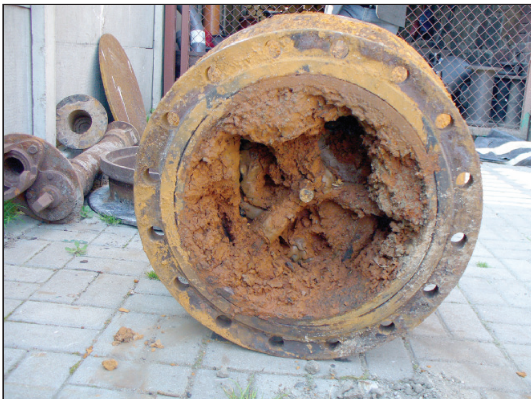
Zawór zwrotny wymontowany z komory zasuw..

Na czerwcowej sesji Rady Miejskiej Kościana, radni zdecydowali o przeznaczeniu środków finansowych na wykonanie ostatniego etapu przebudowy ul. Kaźmierczaka i budowy 400 mb jednostronnego chodnika na tej ulicy. Ponadto na ul. Kaźmierczaka wkrótce zostanie zamontowane także oświetlenie drogowe - poinformował Piotr Ruszkiewicz Przewodniczący Rady Miejskiej.