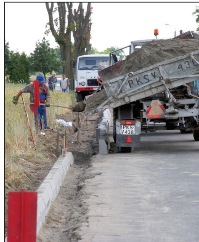
Droga w Gryźynie będzie poszerzona i odwodniona.