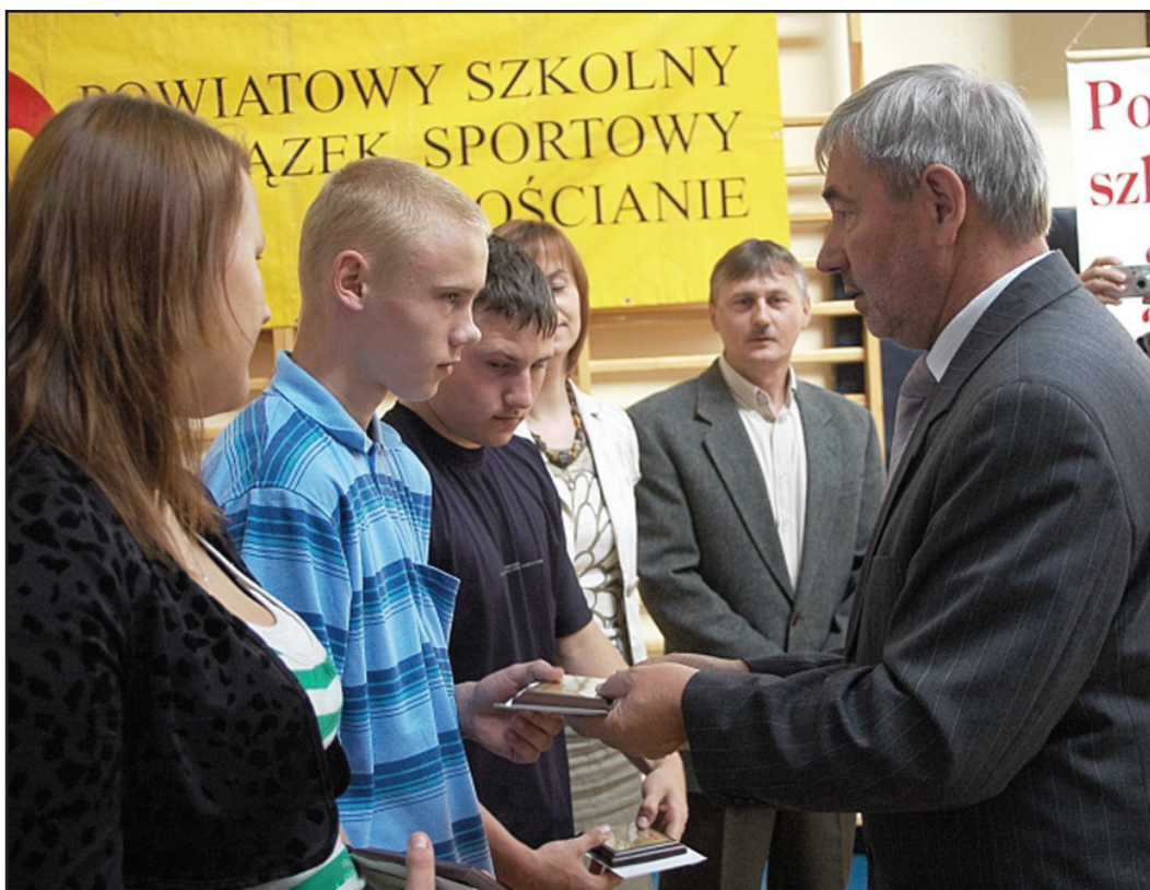
Podczas uroczystości nagrodzono młodych sportowców z naszego powiatu.