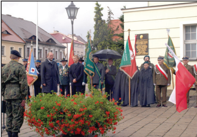
Burmistrz Miasta Kościana przy Tablicach pamięci na Rynku przypomina tragiczne zdarzenia jakie miały miejsce 70 lat temu