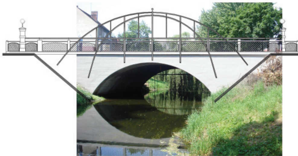
Wizualizacja podwójnych łuków, które ozdobią most na ulicy Piłsudskiego. Łuki zostaną zakotwiczone w skarpie.