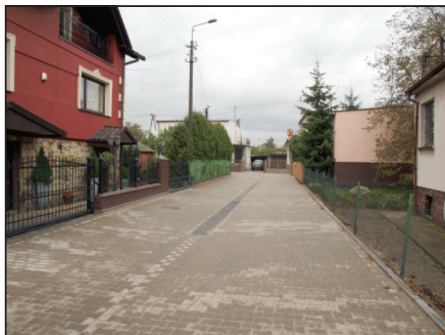
Nowa nawierzchnia na ul. Krzywej