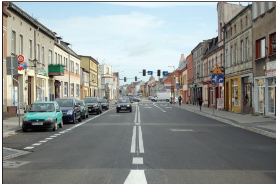
Wyremontowana ulica Piłsudskiego. W przyszłym roku kolej na aleje T. Kościuszki.