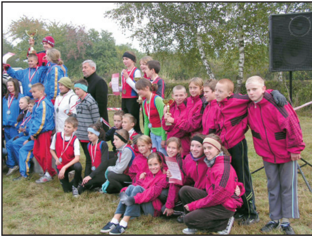
Reprezentanci SP Racot w czerwonych bluzach

W tym dniu w mistrzostwach sztafetowych startowały również reprezentacje dziewcząt i chłopców z Gimnazjum im. Polskich Olimpijczyków w Racocie, które podobnie jak uczniowie ze SP Racot wygrały eliminacje powiatowe. Tego dnia racoeki hipodrom gościł ponad 2000 zawodników i zawodniczek z Wielkopolski, którzy rywalizowali w kategoriach szkół podstawowych, gimnazjów oraz szkół ponadgimnazjalnych. Organizatorem mistrzostw był SZS „Wielkopolska”, a współorganizatorami Starostwo Powiatowe w Kościanie, PSZS w Kościanie, Szkoła Podstawowa i Gimnazjum w Racocie oraz Ośrodek Sportu i Rekreacji Gminy Kościan. W organizacji pomogły również jednostki OSP z Gminy Kościan. (md)