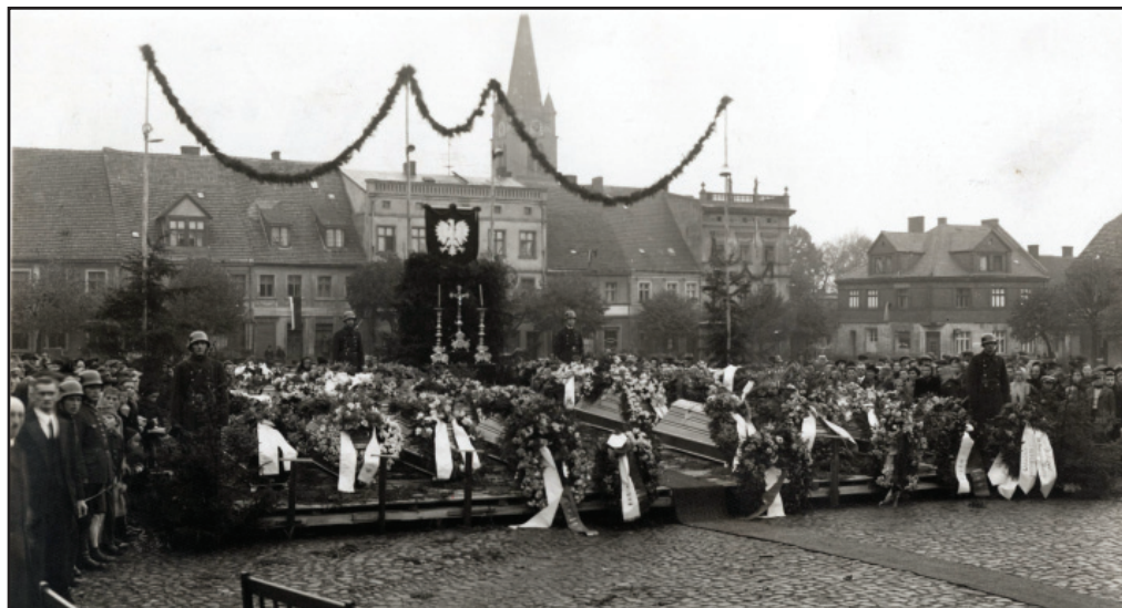
Uroczystości pogrzebowe - 22 października 1945 roku - trumny wystawiono na Placu Rozstrzelanych, naprzeciwko miejsca egzekucji.