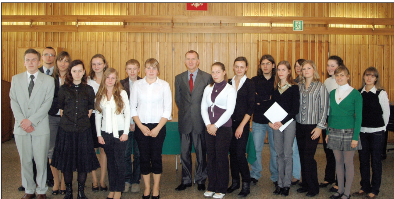
Tegoroczni stypendyści Starosty Kościańskiego

Prace przy upiększaniu mostu potrwać do 20 listopada br. Wykona je pod nadzorem Zarządu Dróg Powiatowych przedsiębiorstwo KOM-EKO z Kościana. Koszt prac to ponad 66 tys. złotych. W poprzednich latach powiat wyremontował w Kościanie ulice Śmigielską, Surzyńskiego i Poznańską. bj