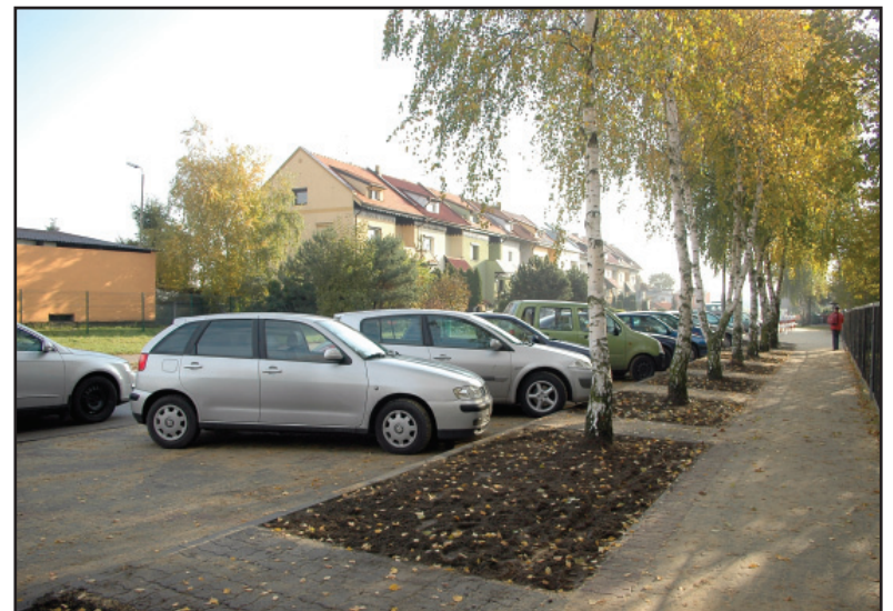
Parking na ulicy Wyzwolenia w Kościanie ma nowe miejsca parkingowe, bezpieczną zatokę autobusową, a przechodniów, przede wszystkim dzieci zabezpieczają bariery ochronne.