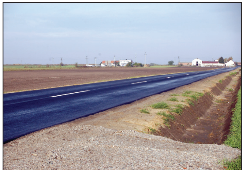
Kończą się prace na drodze powiatowej z Czarkowa do Gryżyny. Koszt inwestycji to ponad 4 miliony złotych.