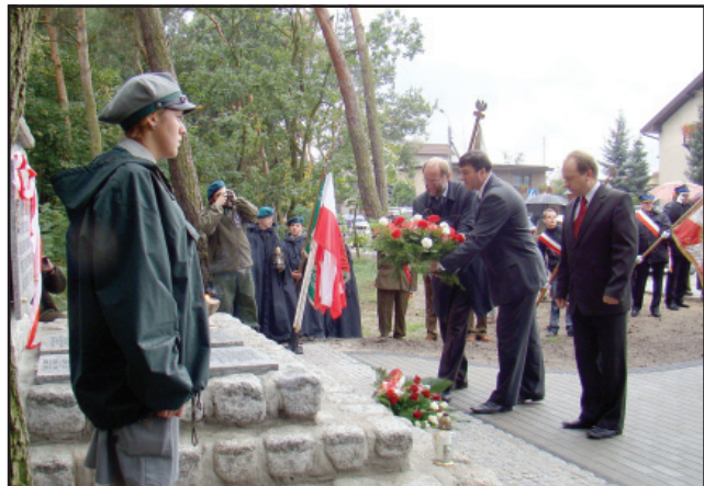
Delegacja władz Miasta Kościana złożyła wiązanki kwiatów pod odnowionym Pomnikiem Rozstrzelanych na ul. Dąbrowskiego