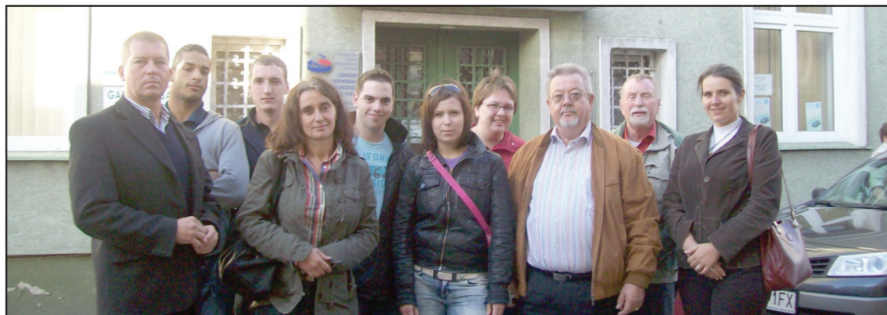
Młodzież z Alzey-Worms praktykowała w Kościanie na przełomie września i października.