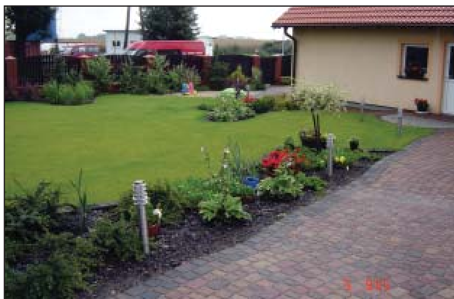
Dom państwa Daś z Widziszewa