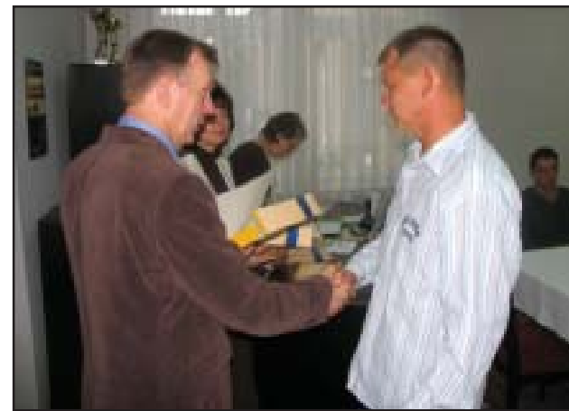
W lipcu dotacje otrzymało 12 osób

Starosta przypomniał, że do tej pory podobne wsparcie otrzymało ponad 220 osób. Ponad 90 % z powodzeniem prowadziło przez rok – czego wymaga umowa – swoją działalność gospodarczą i znaczna część tych osób z powodzeniem ją kontynuuje. Z osób, które otrzymały dotacje najwięcej będzie prowadziła działalność ogólnobudowlaną. Teraz na naszym rynku pracy jest moment – przyznał starosta - w którym poszukiwani są fachowcy. Jest duży popyt na państwa usługi. Jestem przekonany, że sobie państwo poradzicie. Na zakończenie spotkania starosta życzył, by wybrane przedsięwzięcie przyniosło