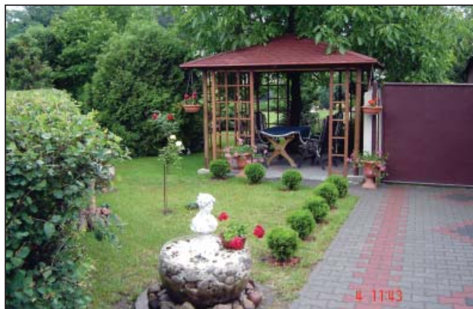
Ogród państwa Wiśniewskich ze Starego Lubosza