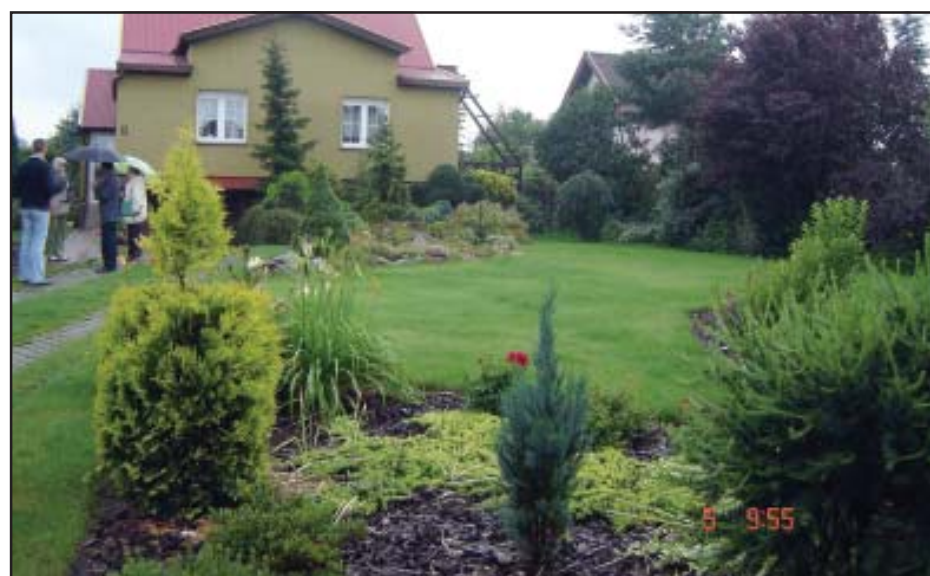
Dom państwa Łuczka w Widziszewie