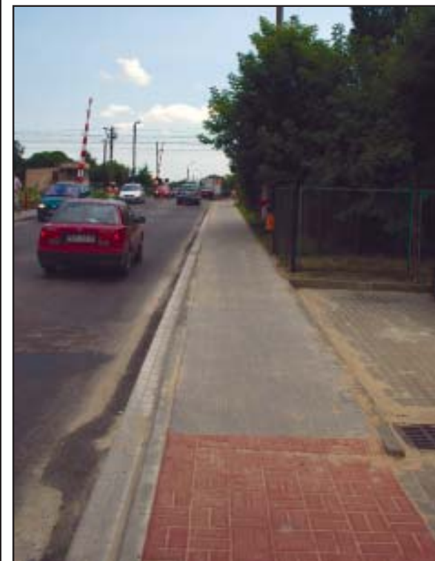
Nowy chodnik kosztował ponad 43 tys. złotych

Zakończył się zlecony przez Zarząd Dróg Powiatowych remont chodnika przy ulicy Młyńskiej w Kościanie. Prace remontowe przeprowadzono na odcinku 160 metrów od Ronda Solidarności do przejazdu PKP, po prawej stronie. Inwestycja warta ponad 43 tysiące złotych wykonało Przedsiębiorstwo Drogowo – Transportowe „DROG-TRANZ” z Góry. bj