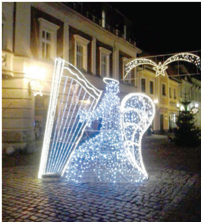
Na deptaku w ul. Wrocławskiej stanął anioł świetlny z harfą

długości czterystu metrów, bieżnia przystosowana do skoku w dal, do skoku wzwyż oraz rzutnia lekkoatletyczna. Na stadionie zostanie zamontowanych także sześć punktów oświetlenia typu LED. Obiekt ma służyć nie tylko mieszkańcom Kościana, ale i także mieszkańcom okolicznych gmin, dlatego miasto prowadzi rozmowy o ewentualnym dofinansowaniu inwestycji przez samorządy. Zakończenie prac szacuje się na koniec października 2016r.