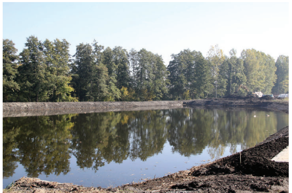
Staw w Racocie