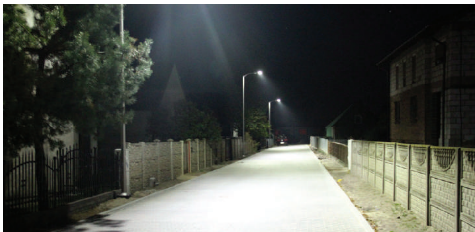
Oświetlenie w Starym Luboszu

szkoły w Starej Przysiece Drugiej, oraz montażu słupów oświetleniowych z oprawami ledowymi na wysięgnikach w ilości 17 sztuk w Bonikowie, 8 lamp w Czarkowie i 9 w Widziszewie. Podobne rozwiązanie oświetlenia ulicznego zastosowano przy przebudowywanych ulicach w Starym Luboszu. Na łącznej długości 1229 m zamontowano 27 lamp, a koszt tych prac wyniósł 212.133,11 zł. (md)