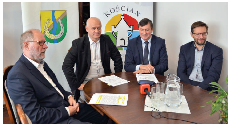
W dniu 18 października bieżącego roku, w gabinecie Burmistrza Miasta Kościana odbyła się wspólna konferencja prasowa Burmistrza Miasta Kościana oraz Wójta Gminy Kościan dotycząca odnawialnych źródeł energii w gospodarstwach domowych.

W Mieście Kościan w ramach projektu zainstalowanych zostanie 330 instalacji z udziałem odnawialnych źródeł energii (304 fotowoltaika, 26 kolektory słoneczne). Wytworzona przez odnawialne źródła energia zostanie spożytkowana na potrzeby gospodarstw domowych. Wartość projektu dla Miasta Kościana to 5.180.650 złotych, z czego dofi-