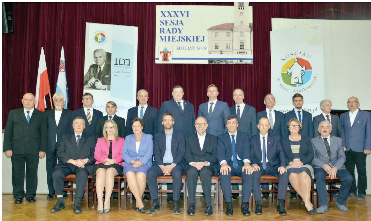
Radni Rady Miejskiej Kościana VII kadencji.