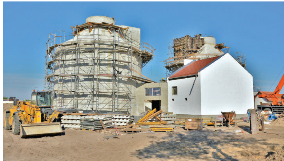
Trwają prace na budowie oczyszczalni ścieków w Kielczie.

aktywami, mającymi na celu zmniejszenie kosztów operacyjnych. Ponadto celem jest zwiększenie efektywności w zakresie odprowadzania, usuwania, oczyszczania i eliminacji ścieków komunalnych. W ramach realizacji procesu istotne jest zmniejszenie o 50% ilości osadów ściekowych przeznac-