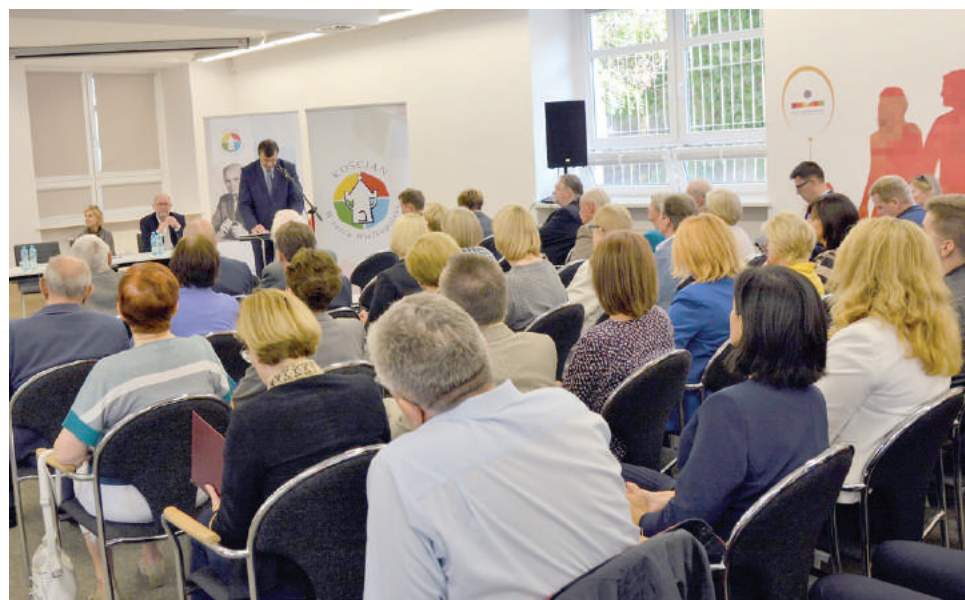
Sesja popularnonaukowa cieszyła się dużym zainteresowaniem mieszkańców.