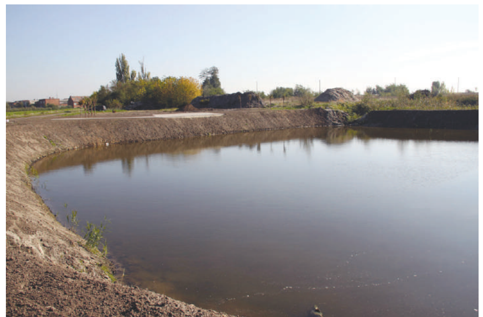
Staw w Szczodrowie

pochłonął 98.323,79 zł, a kwota dofinansowania ma wynieść 62.563 zł, tj. 63,63 % poniesionych wydatków. Operacja druga pn. „Odnowa i zagospodarowanie stawu w Racocie oraz zadrzewienia śródpolne w Gryżynie pomostem między przyrodą i dziedzictwem regionu” przyczyni się do poprawy krajobrazu oraz wzbogacenia wartości i zasobów przyrodniczych w miejscach bogatych historycznie i kulturowo, a także otworzy możliwości rozwoju turystyki i rekreacji na bazie zrewitalizowanych obszarów. Kwota wydatków na odnowienie stawu w Racocie wyniosła 185.089,18 zł, a wartość dofinansowania osiągnie 117.772 zł, tj. (md)