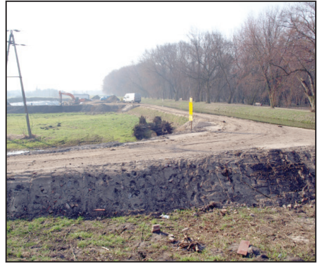
Trwają prace przy budowie jazu przy Kościańskim Kanale Obrzy

Na przyległym do parku Kościańskim Kanale Obrzy trwa inwestycja realizowana przez Wielkopolski Zarząd Melioracji i Urządzeń Wodnych w Poznaniu - budowa jazu, który będzie regulował poziom wody w Kanale Obrzy.