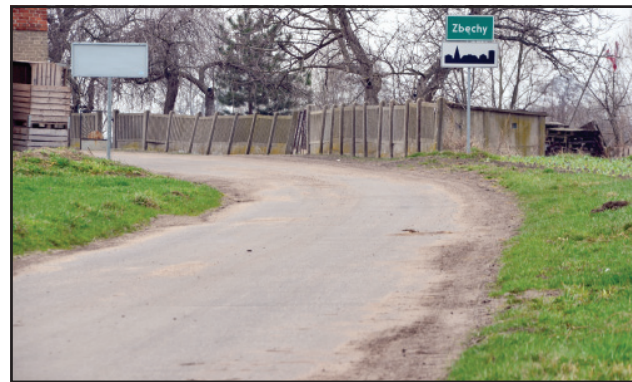
Inwestycja na drodze w Zbęczach zostanie zrealizowana za kwotę ponad 368 tys. złotych.