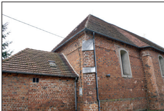
Wsparcie w wysokości 17 tys. złotych na remont dachu nad zakrystią otrzymała także Parafia Rzymskokatolicka pw. NMP Pocieszenia i św. Mikołaja w Starych Oborzyskach.