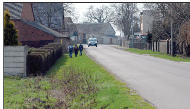
Kontynuacja przebudowy drogi powiatowej w Poladowie będzie kosztowała ponad 255 tys. złotych.