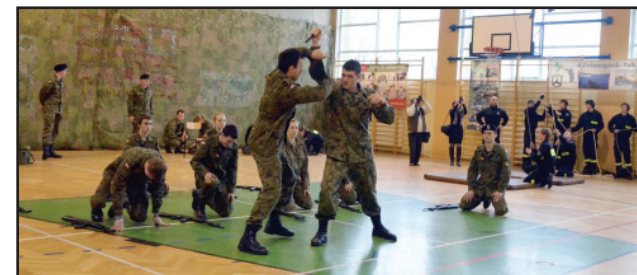
Zapraszamy do klas o profilu wojskowym, strażacko - ratowniczym i policyjnym.

siedzibie Starostwa Powiatowego w Kościanie, przy ul. Gostyńskiej 48, p. 203.