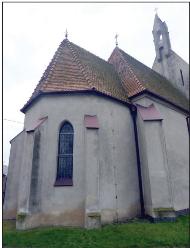
Na remont kościoła pw. św. Wawrzyńca Diakona i Męczennika w Wonieściu Powiat Kościański przeznaczył kwotę 10 tys. złotych, za które ma być wykonana renowacja pokrycia dachowego nad prezbiterium, zakrystią i kruchtą.

Łączna kwota udzielonego przez Powiat wsparcia na prace konserwatorskie, restauratorskie i roboty budowlane przy zabytkach wpisanych do rejestru zabytków niestanowiących własności Powiatu Kościańskiego wyniosła 130 tys. złotych. hg