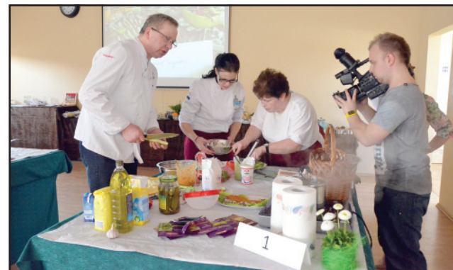
Zaprasza technikum żywienia i usług gastronomicznych.