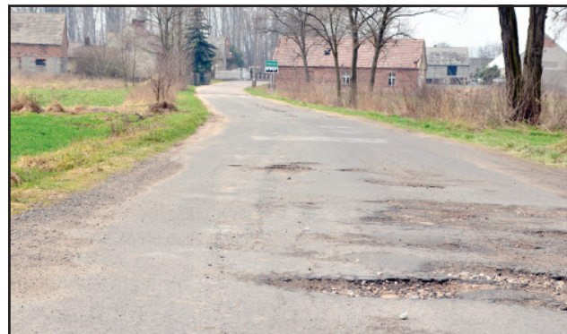
Koszt modernizacji drogi w Bonikowie wyniesie ponad 174 tys. złotych.

Poza tymi inwestycjami samorząd powiatowy w tym roku przeprowadzi modernizację chodników w Czempiniu, Gorzycach i Gorzyczkach. bj