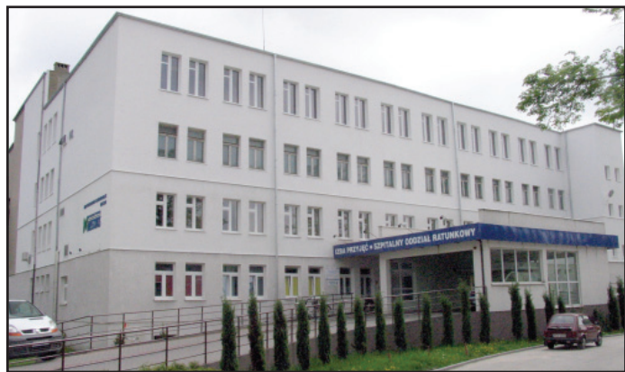
Pierwszy etap prac przy budowie nowego bloku operacyjnego w kościańskim szpitalu zakończy się w grudniu tego roku.

Został rozstrzygnięty przetarg na rozbudowę i przebudowę pomieszczeń Samodzielnego Publicznego Zespołu Opieki Zdrowotnej w Kościanie, w których powstanie blok operacyjny i sterylizatornia. W ramach prac, które zakończą się w grudniu 2013 roku, zostanie także wykonana nadbudowa klatki schodowej.