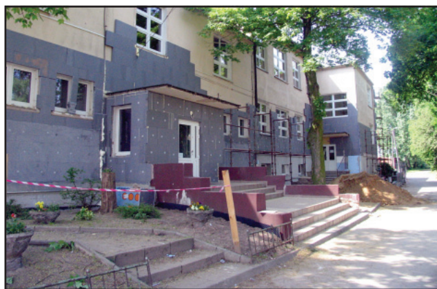
Prace przy termomodernizacji budynków Zespołu Szkół im. Jana Kasprowicza w Nietążkowie.

Przedsięwzięcie o łącznej wartości około 2 mln zł jest współfinansowane ze środków Europejskiego Funduszu Rozwoju Regionalnego, który pokrywa 75% kosztów inwestycji. Pozostałe 25% wartości przedsięwzięcia zostanie sfinansowane z budżetu Powiatu Kościańskiego. mr