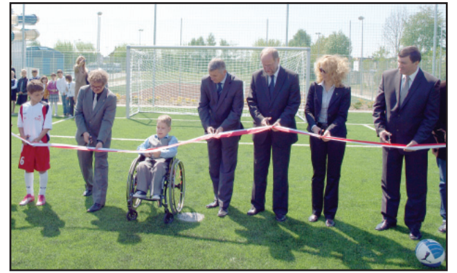
Oficjalne symboliczne przecięcie wstęgi

Do godz. 14.00 obiekt będzie służył uczniom szkoły, od 14.00 do 21.30 - grupom sportowym, jak i wszystkim zainteresowanym aktywnym uprawianiem sportu. Na obu boiskach odbywają się treningi zespołów sportowych i grup młodzieżowych oraz imprezy rekreacyjne. Korzystanie z boisk jest nieodpłatne, trzeba jednak zebrać grupę od 10-12 os. i zgłosić się osobiście lub pod nr tel. 795 72 33 82.