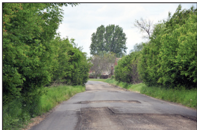
Droga Stary Gołębin - Gorzyce

Rozpoczęły się także prace na trasie Stary Gołębin - Gorzyce obejmujące frezowanie, oczyszczenie i skropienie nawierzchni. Na drodze zostanie położona nowa nawierzchnia wykonana z mieszanki mineralno-bitumicznych asfaltowych. Roboty zostaną wykonane na powierzchni 4,5 tys. m 2 . Koszt prac, prowadzonych przez firmę POL-DRÓG z Kościana, wyniesie ponad 271 tys. zł. Pieniądze na remont w całości pochodzą z budżetu Powiatu Kościańskiego. mr