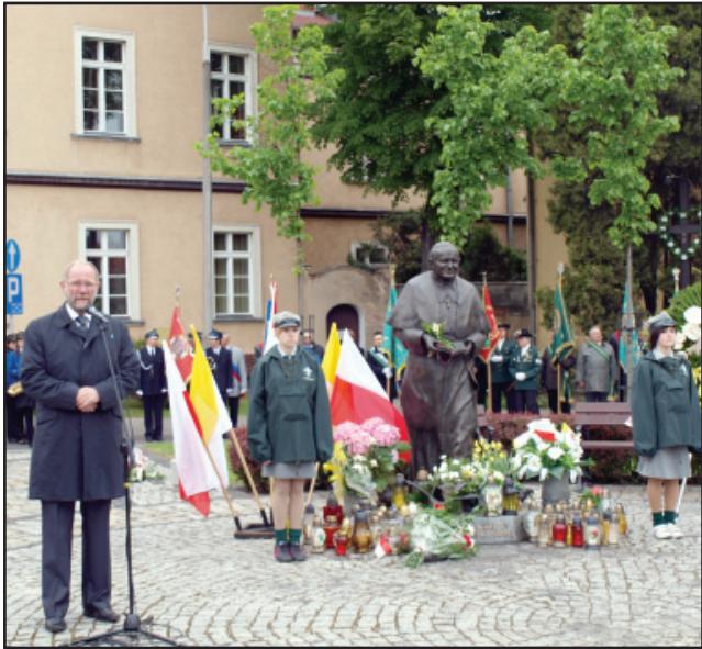
Podczas uroczystości patriotycznych na Pl. Niezłomnych Burmistrz Miasta Kościana podkreślał znaczenie Konstytucji i Beatyfikacji dla Polaków