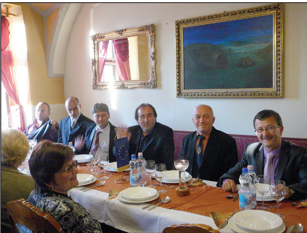
Spotkanie z władzami Sümeg

Organizatorzy przygotowali bardzo bogaty program pobytu. W szkole odbyła się wspólna lekcja języka angielskiego oraz w zajęcia sportowe. Bardzo atrakcyjną była także nauka ludowego tańca węgierskiego. Gimnazjaliści z Oborzysk uczyli węgierską młodzież