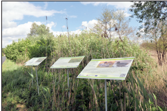
Tablice edukacyjne zainstalowane w okolicach Rąbina.

– Wyskoć - Rogaczewo Wielkie – Rogaczewo Małe – Rąbina – Turew – Stary Gołębina – Spytkówki. Łączna długość trasy to ok. 30 kilometrów, wzdłuż ścieżki rozmieszczone są tablice edukacyjne opisujące gatunki roślin i zwierząt.