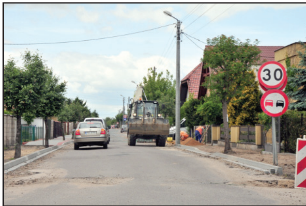
Ulica Sierakowskiego w Kościanie