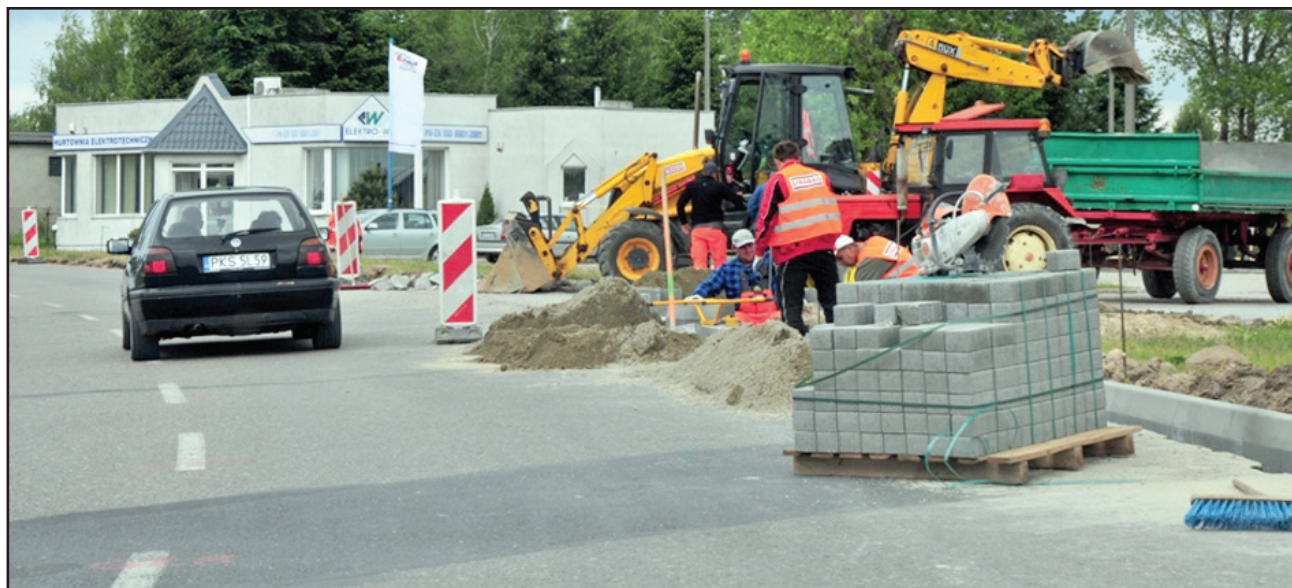
Ulica Północna w Kościanie