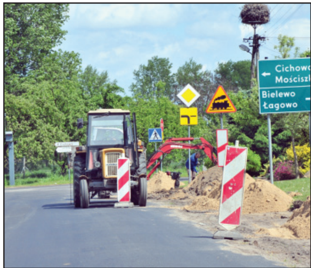
Prace przy budowie ścieżki Lubień - Cichowo