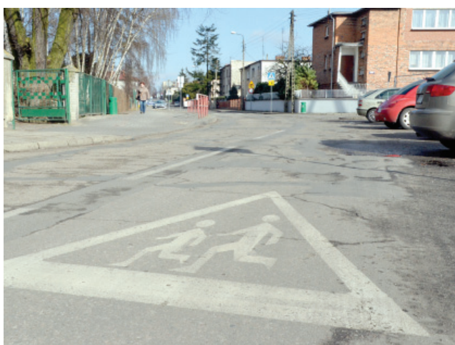
Ulica Szkolna w Kościanie zostanie przebudowana na półkilometrowym odcinku od skrzyżowania z ulicą 27 Stycznia do skrzyżowania z ulicą Północną.