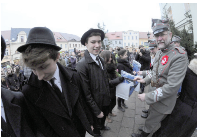
Zwycięska drużyna licealistów z Kościana odbiera nagrodę

Gra Miejska pn. „Kryptonim Wolność” została dofinansowana ze środków Fundacji BZWBK w ramach programu grantowego „Bank Ambitnej Młodzieży”. W tym roku po raz pierwszy współorganizatorem była Gmina Wiejska Kościan.