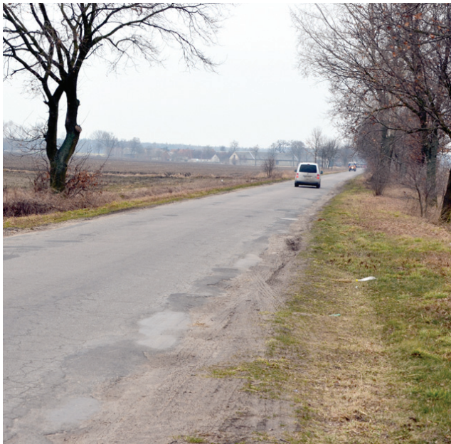
Nowa nawierzchnia bitumiczna położona zostanie na ponad dwukilometrowym odcinku drogi Gniewowo-Wonieść.