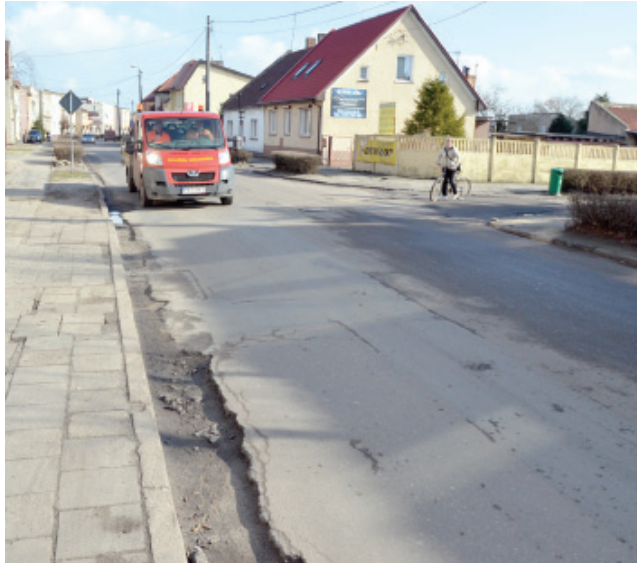
Ulica Wielichowska w Kościanie przebudowana będzie od ronda na skrzyżowaniu z ulicą Surzyńskiego do skrzyżowania z ulicami: Kaźmierczaka, Piaskową i królowej Jadwigi.