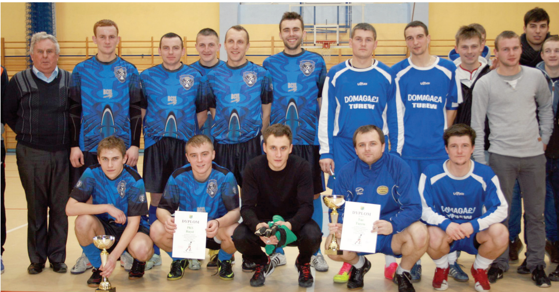
Triumfatorzy kategorii drużyn zrzeszonych