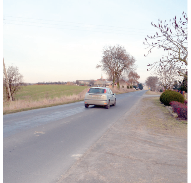
W Lubiniu zostanie zbudowany 600 metrowy ciąg pieszo-rowerowy.