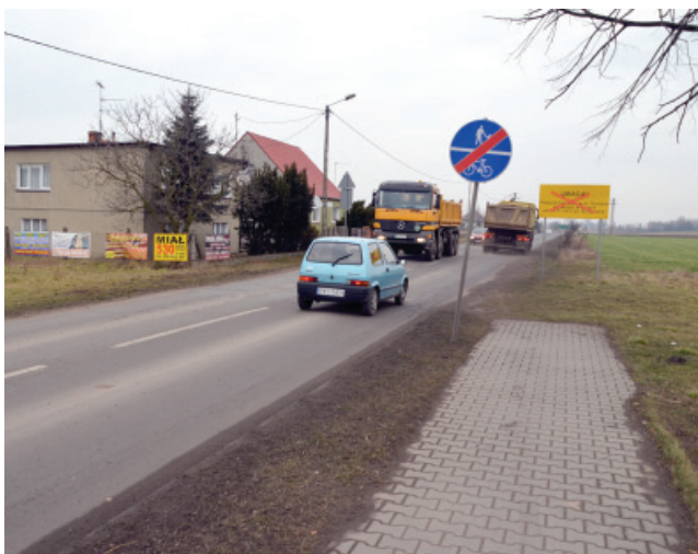
Nowa ponad trzykilometrowa ścieżka rowerowa będzie prowadziła od Czempina do granicy z powiatem śremskim.

Poza wymienionymi inwestycjami w tym roku zostaną także między innymi przebudowane odcinki dróg w Wieszkwie, Zglińcu, Krzywiniu, Jurkowie, Darnowie, Donatowie, Zbęczach (przy cmentarzu), Czempiniu. hg