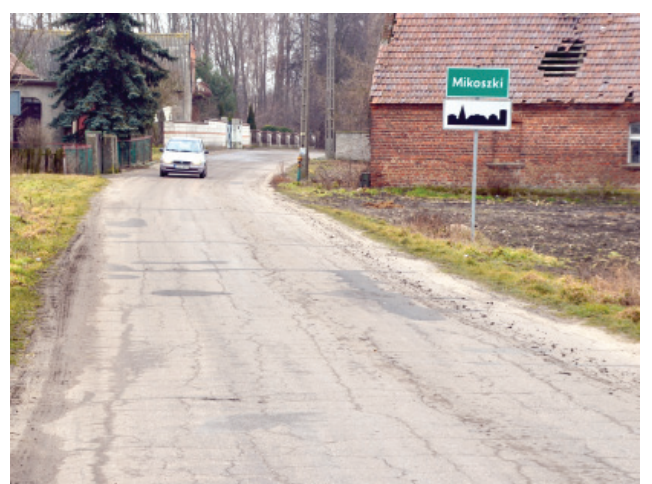
Na odcinku drogi między Jarogniewicami a Mikoszkami położona zostanie nowa nawierzchnia bitumiczna, wzmocnione zostaną także pobocza z obu stron.