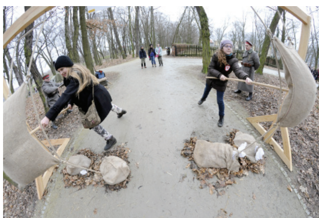
Najbardziej emocjonujące misje przeszkolenia wojskowego odbywały się w parku miejskim