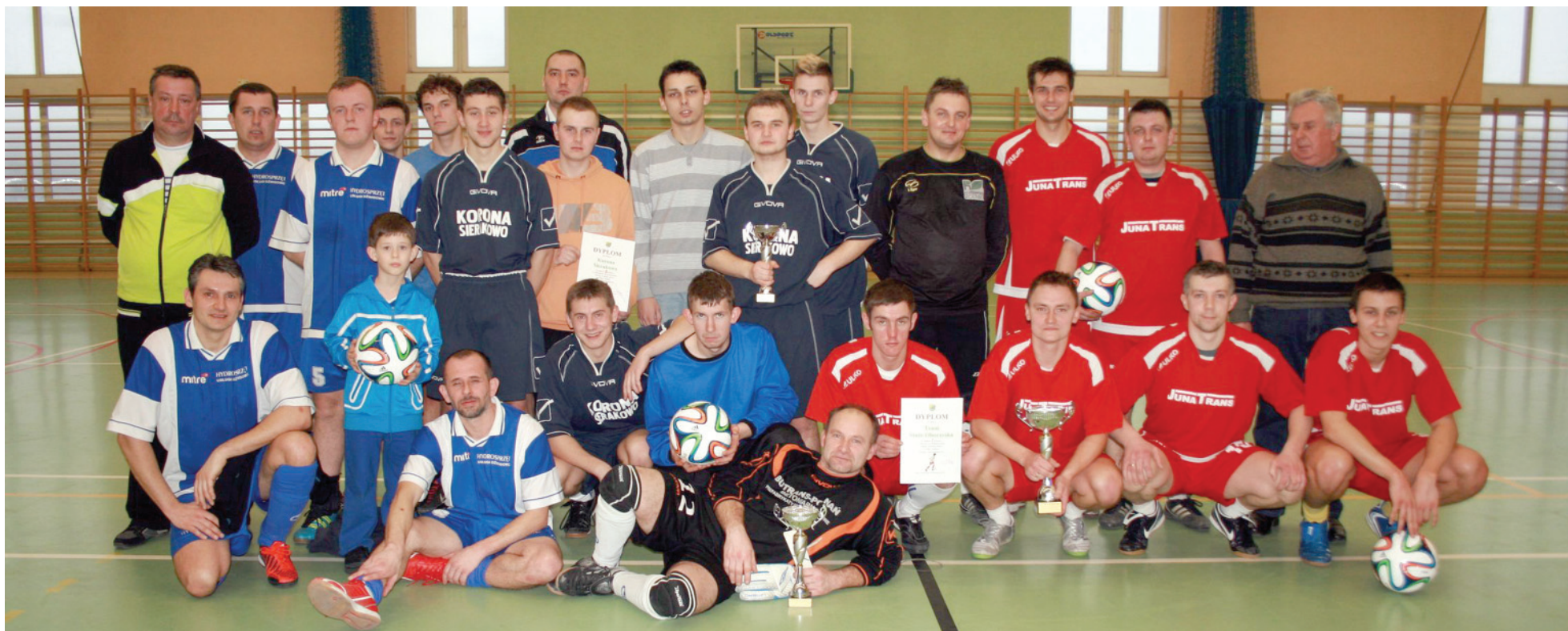
Najlepsze drużyny w kategorii niezrzeszonych