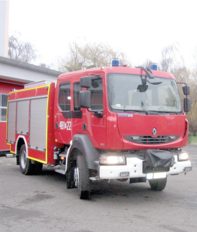
Mieszkańcy powiatu mogą liczyć na niezawodną straż pożarną.

Mieszkańcy powiatu mogą liczyć na szybką pomoc strażaków. W minionym roku by dotrzeć do zdarzenia, w którym poszkodowane były osoby, strażacy potrzebowali od przyjęcia zgłoszenia 6 minut 41 sekund. W 2013 roku strażacy udzielili 100 osobom kwalifikowanej pierwszej pomocy. Strażacki „zegar ratowniczy” wskazał również, że pożar w naszym powiecie miał miejsce co 65 godzin i 25 minut. Z kolei zdarzenia, w których strażacy nieśli pomoc miały miejsce co 11 godzin i 20 minut. Średnio na podjęcie interwencji we wspomnianych zdarzeniach - od momentu przyjęcia zgłoszenia - strażacy z Komendy Powiatowej Pań-